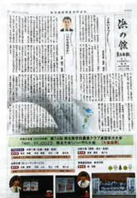
育友会広報紙「浜の館」

本校は平成22年度に旧矢部高等学校と蘇陽高等学校とが再編統合し、現在の矢部高等学校として開校しました。本校では、「自ら気づき、考え行動する」という教育スローガンのもと、すべての教育活動をとおして、生徒の主体性や自らを律する力を育成します。本校は食農科学科、林業科、普通科の3学科で構成され、生徒の進路に応じた学習を行います。熊本県の「スーパーグローバルハイスクール」「クリエイティブハイスクール(地域課題解決型)」の指定も受け、それぞれの特色を生かし、地域に密着した探究的な学習をとおして「実践する力」にも磨きをかけています。また、山都町の支援のもと、「地域みらい留学」を活用し、生徒の全国募集にも取り組んでいます。