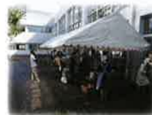
育友会バザー出店(文化祭)