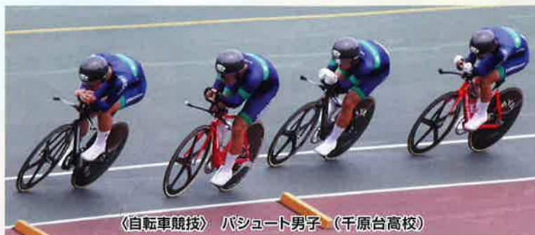
〈自転車競技〉 パシュート男子 (千原台高校)