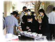
育友会豚汁作り(長距離走大会)