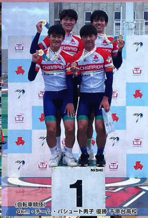
〈自転車競技〉 4km・チーム・パシュート男子 優勝 千原台高校