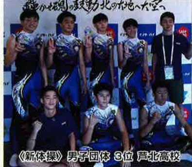
〈新体操〉 男子団体 3位 芦北高校