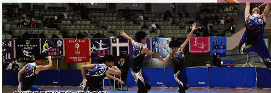
新体操男子団体演技 (芦北高校)